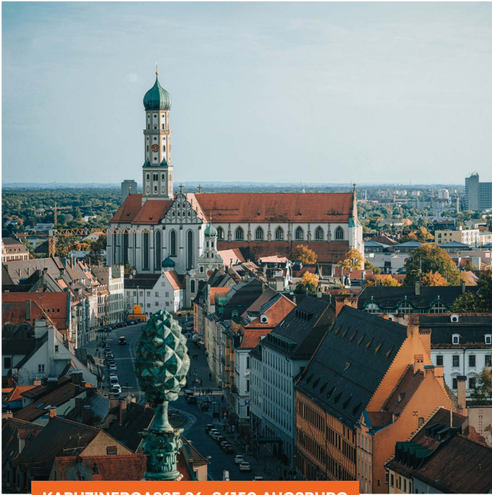
KAPUZINERGASSE 26, 86150 AUGSBURG